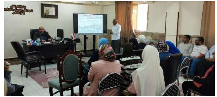
صور من داخل المحاضرة التي تم فيها شرح اهداف الخطة الاستراتيجية للمعهد