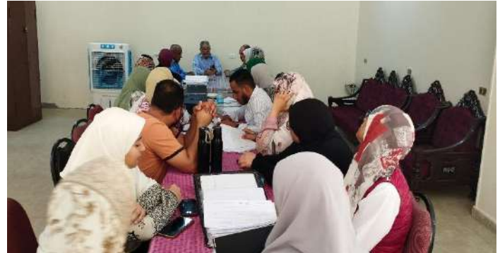
صور من ورشة عمل لمراجعة المعايير للاعتماد المؤسسي